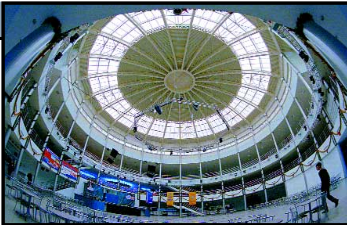
ТЦ «Дирижабль» - наиболее яркий объект, воплотивший достижения местных проектировщиков.

такого подхода к созданию ТЦ – «Универбьют», где на территории 4200 кв.м расположено 72 магазина. Этот объект известен в городе как самый тесный ТЦ, но покупатели охотно посещают его. Видимо, это связано с частыми и массовыми распродажами.