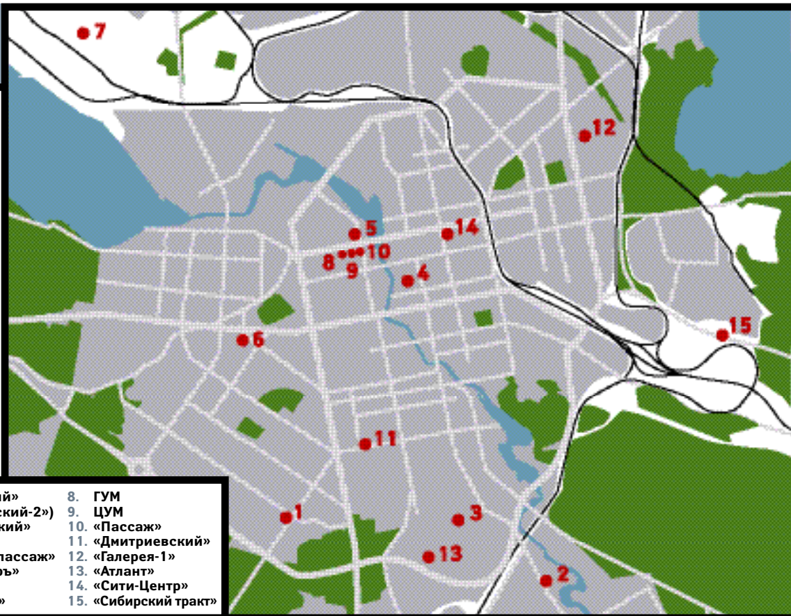
Крупнейшие торговые центры Екатеринбурга: советские, российские, европейские.

» ны тематические зоны (детская, мужская и женская одежда, обувь) и сгруппированы арендаторы. Появились якорный арендатор «Эльдорадо», ресторан быстрого питания «Мак-Пик», детская игровая площадка. Сегодня это третий по величине ТЦ в городе. В последние два года во многих уже построенных ТЦ произошли существенные изменения. Управляющие компании провели группировку мест по видам товаров, зонирование; привлекли якорных арендаторов; организовали зоны отдыха, развлечения, питания; расширили спектр услуг; ввели продажу билетов, упаковку подарков, открыли парикмахерские, пункты обмена валюты. Наиболее яркий пример таких изменений – ТЦ «Юго-Западный», принадлежащий холдинговой компании «Лидер». Этот двухэтажный объект общей площадью 20 тыс. кв.м, построенный в 1999 г., окупился менее чем за год. Однако в 2002 г. его реконструировали. Появились якорные арендаторы – на первом этаже супермаркет «Монетка» площадью 4000 кв.м и на втором этаже магазин бытовой техники «Кардинал». Началась группировка арендаторов по зонам, а вывеска сменилась с «Юго-Западный» на «Екатерининский-2». Но большинство горожан по привычке называют его «Юго-Западным».