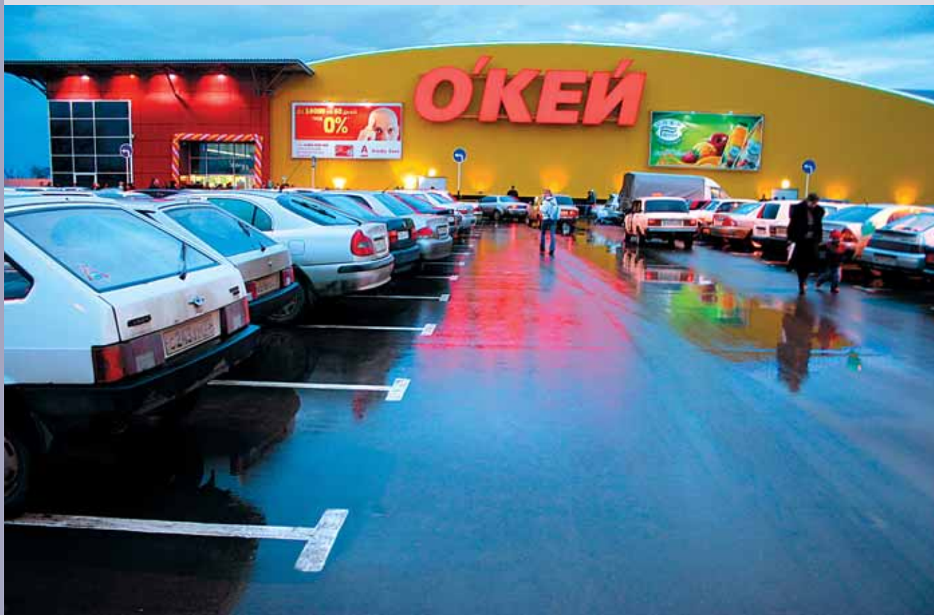
ПОДЗЕМНАЯ ПАРКОВКА ГИПЕРМАРКЕТА «О'КЕЙ» РАССЧИТАНА НА 650 МАШИНО-МЕСТ