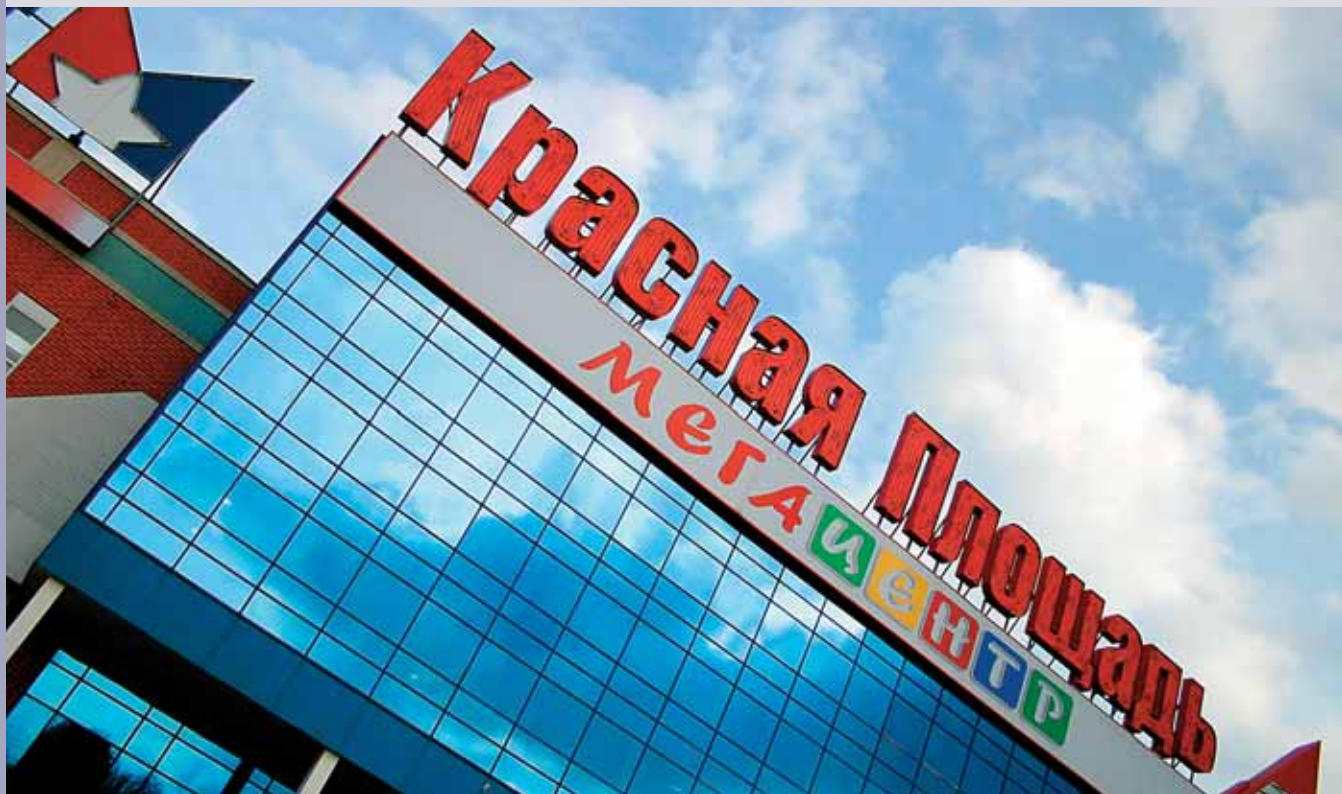
МЕГАЦЕНТР «КРАСНАЯ ПЛОЩАДЬ»