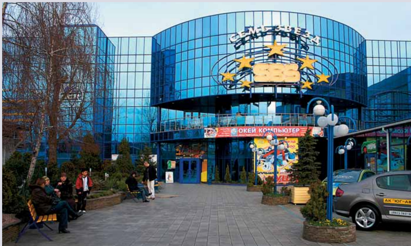
РАЗВЛЕКАТЕЛЬНЫЙ ЦЕНТР «СБС-СЕМЬ ЗВЕЗД»

дают «Банана-Мама», «Детский мир», «Бегемот», «Радуга». Развиваются местные сети общественного питания — «Жар-Пирца», «Любо-Дорого», «Любо-Кафе», Il Tempo Pronto , «Уни-пицца», «Масленица», «Блинкофф», «Джунгли экспресс», «Минами». Эти предприятия, в отличие от вышедших в город «Ростикса» и McDonalds , размещаются не только в торговых центрах, но и на улицах.