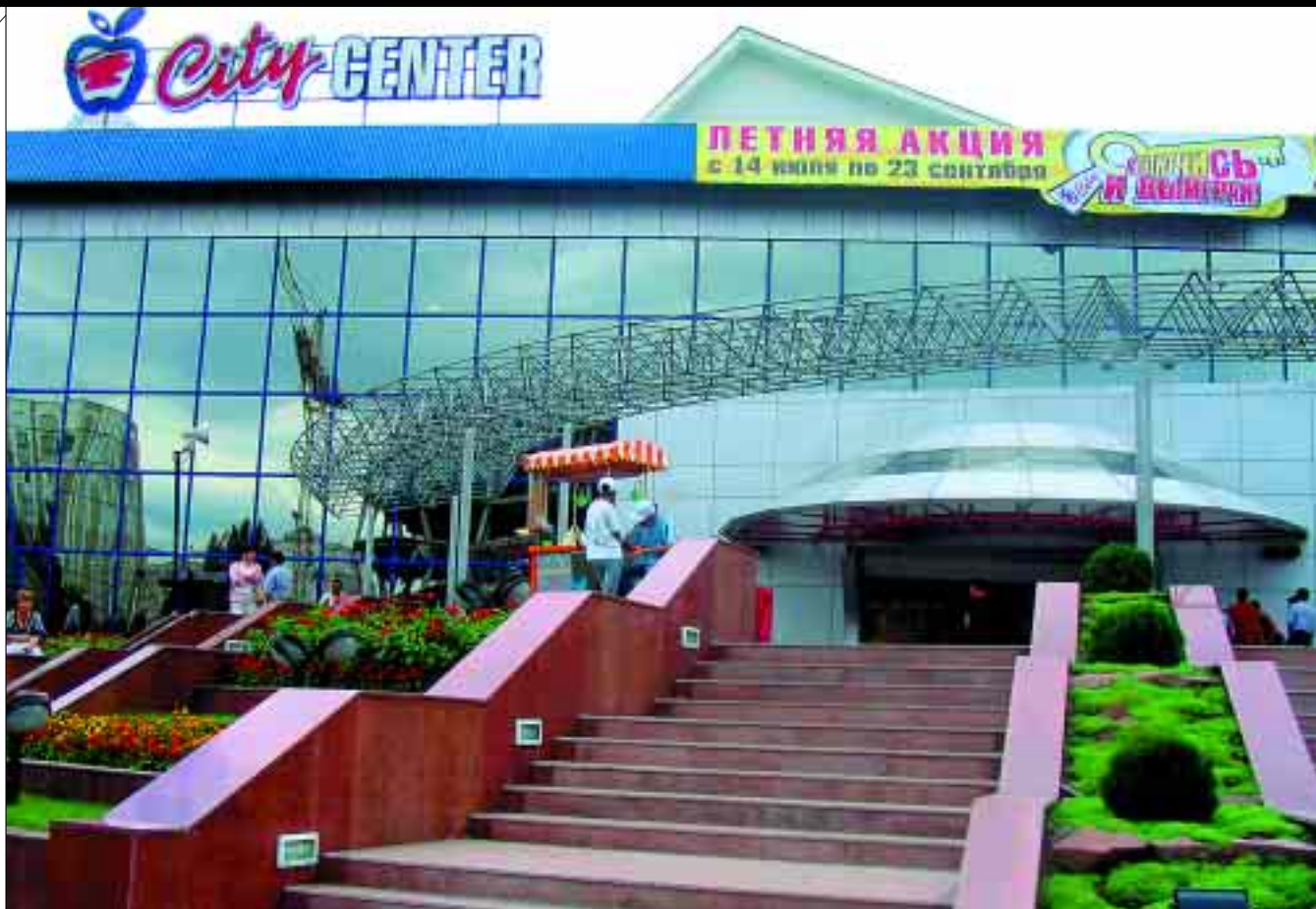
В ГОРОДЕ РАЗВИВАЮТСЯ СЕТИ ТЦ «СИТИ ЦЕНТР» НА УЛ. ТОЛЕ БИ.

В ГОРОДЕ РАБОТАЕТ БОЛЕЕ 1000 ПРЕДПРИЯТИЙ ОБЩЕСТВЕННОГО ПИТАНИЯ, В ЧАСТНОСТИ 258 РЕСТОРАНОВ, ИЗ КОТОРЫХ 70 — СЕТЕВЫЕ.