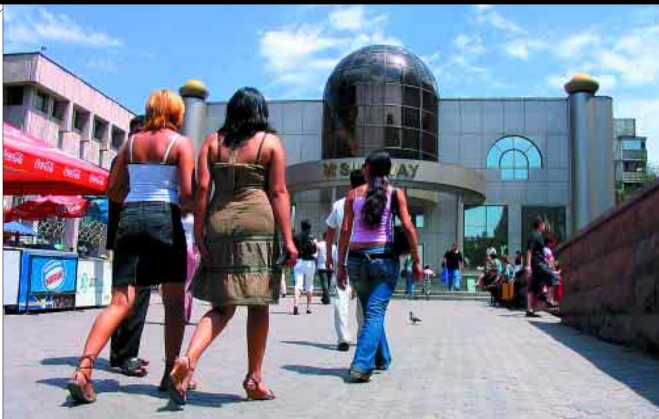
НА ПРОСПЕКТЕ ЖИБЕК ЖОЛЫ («АРБАТЕ») ВСЕГДА МНОГОЛЮДНО .