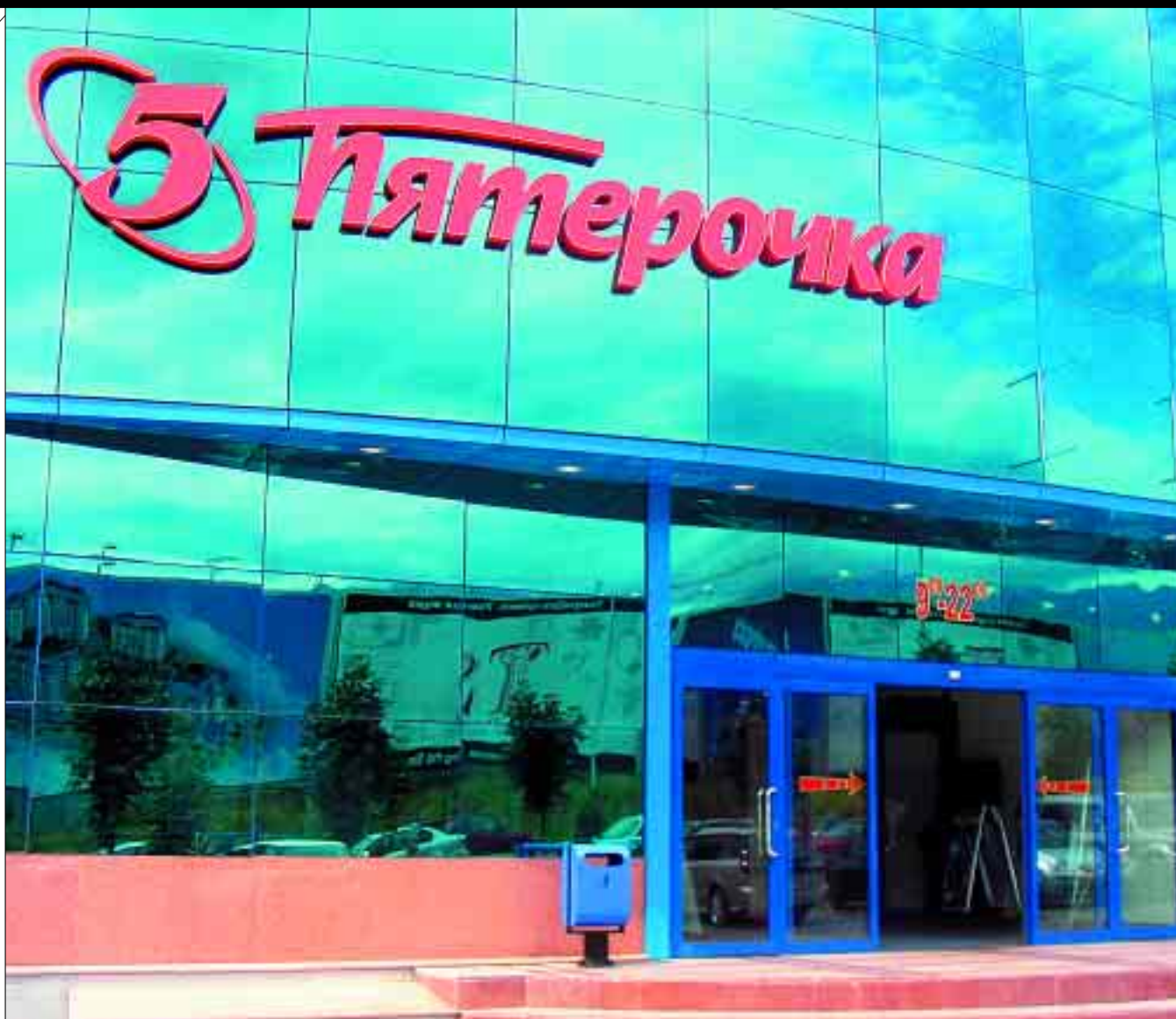
СЕТЬ «ПЯТЕРОЧКА» ОТКРЫЛА 35 МАГАЗИНОВ В ГОРОДЕ.