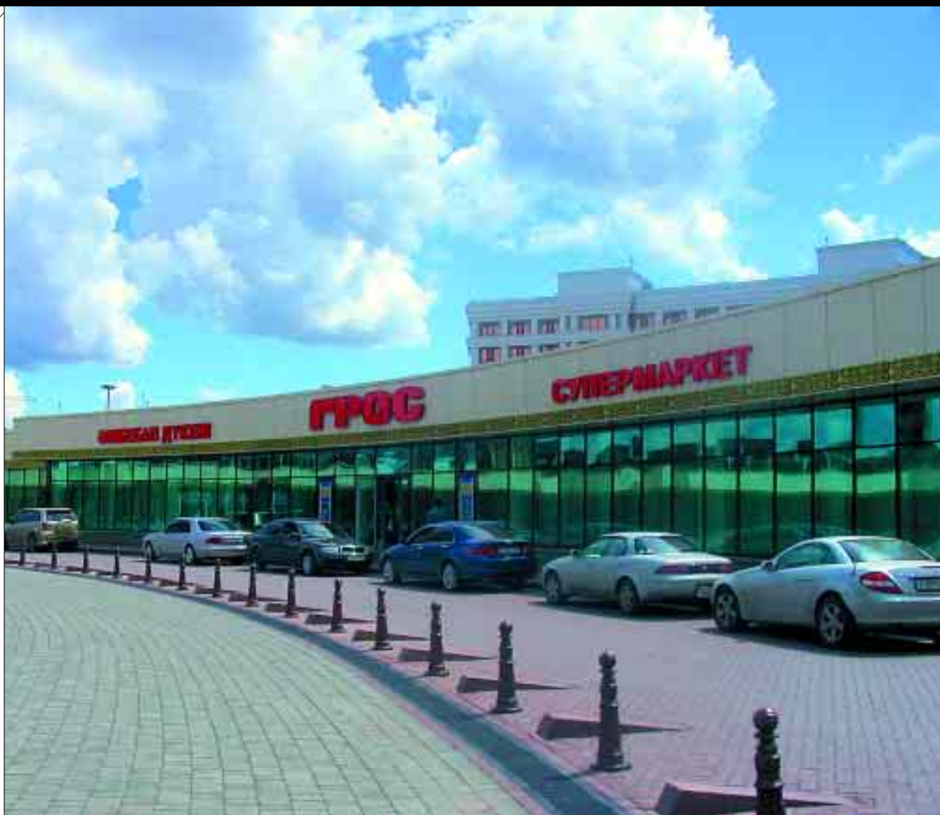
СУПЕРМАРКЕТ «ГРОС» В КОМПЛЕКСЕ ЗДАНИЙ КАЗМУНАЙ ГАЗА.

► бавят к счету 10% «за обслуживание», вне зависимости от вашего мнения о его качестве. Помимо «Сине Темпоре», к торговым комплексам принято относить и здание, занимающее выгодное положение возле моста через Есиль. Там находится супермаркет «Рамстор», однако второй этаж представляет собой галерею из нескольких «суррогатных» магазинов, включая пресловутую ZARA со скачущими продавцами и прокуренное кафе. Также к торговым комплексам относится и City Market на ул. Иманова, внутри более похожий на баскетбольную площадку: по периметру огромного зала в два этажа располагается около 40 бутиков. В 2006 г. на пр-те Абая, рядом с гостиницей «Интерконтиненталь», открылся небольшой торговый комплекс «Мерей-Контти» (девелопер — OKAN Holding) с кафе и бутиками. Львиная доля оборота розничной торговли в Астане делается на открытых, а также крытых вещевых рынках (торговых комплексах) на правом берегу, напоминающих московский ОРТЦ «Москва» в Люблино. В каждом из таких комплексов на нескольких