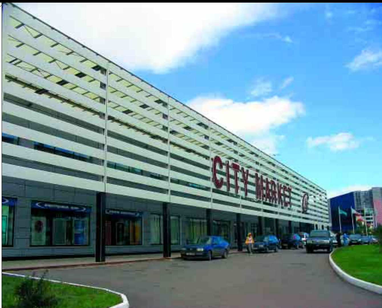
ТОРГОВЫЙ КОМПЛЕКС CITY MARKET.