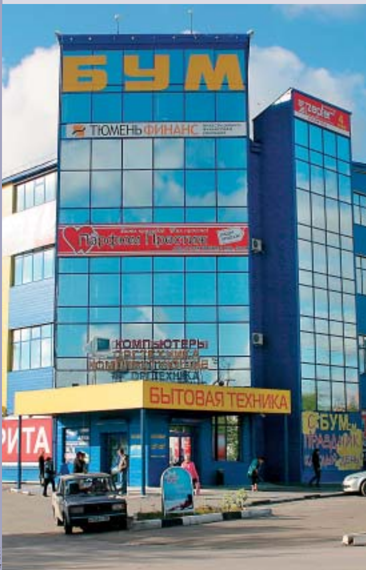
ТК «БУМ» С ПЕРВЫМ В ГОРОДЕ ПАНОРАМНЫМ ЛИФТОМ