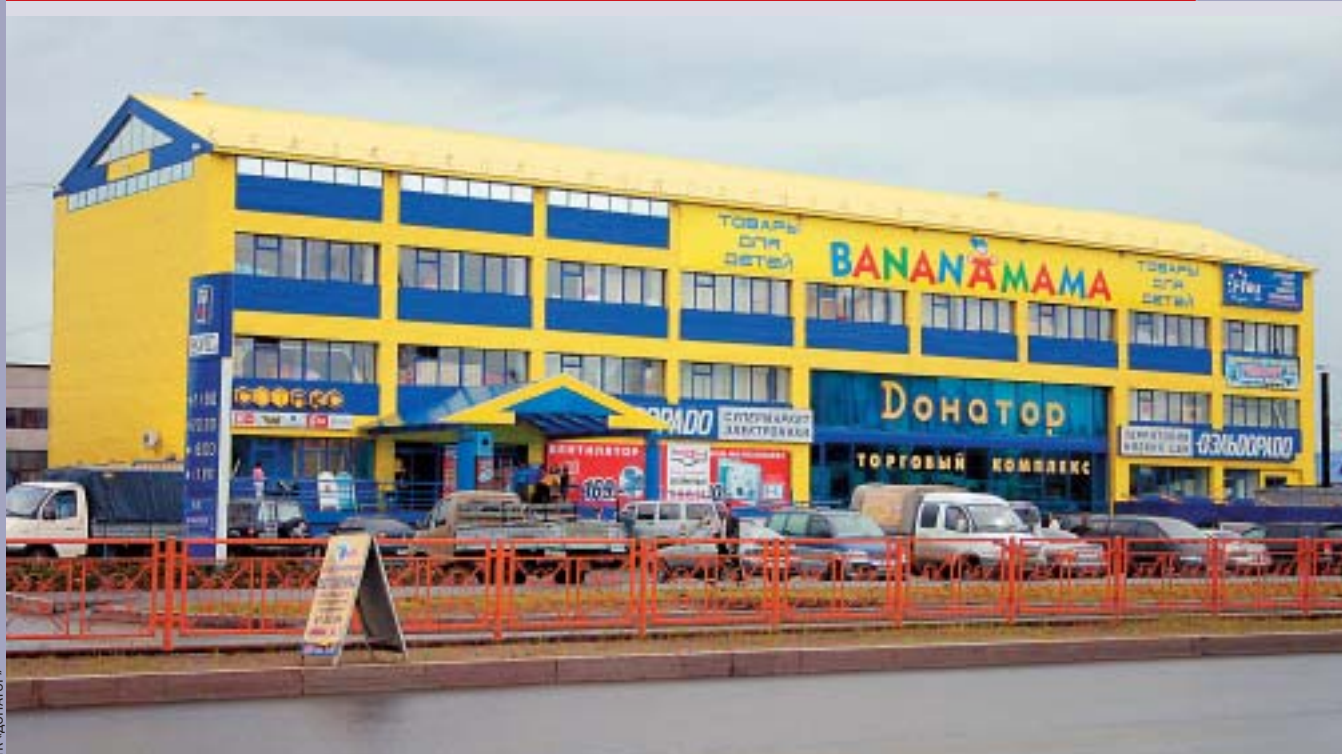
В ГОРОДЕ НАСЧИТЫВАЕТСЯ 813 МАГАЗИНОВ ТОРГОВОЙ ПЛОЩАДЬЮ 58 ТЫС.КВ.М