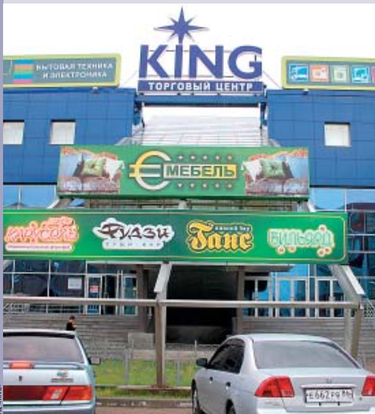
ФЕДЕРАЛЬНЫЕ ДЕВЕЛОПЕРЫ АТАКУЮТ