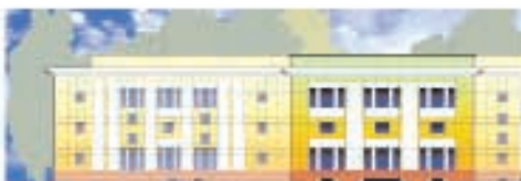
Торгово-развлекательный центр, г. Воскресенск Общая площадь – 16 000 м². Торговая площадь – 10 000 м². Открытие – III квартал 2007 года.