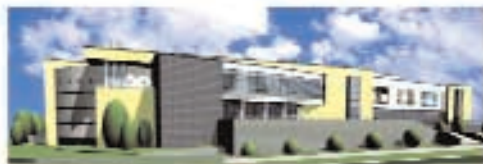
Торгово-развлекательный центр, г. Ижика Общая площадь – 45 000 м². Торговая площадь – 27 000 м². Открытие – III квартал 2008 года.