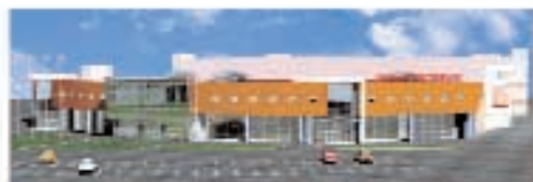
Торгово-развлекательный комплекс, г. Тольятти Общая площадь – 30 000 м². Торговая площадь – 25 000 м². Открытие – I квартал 2008 года.