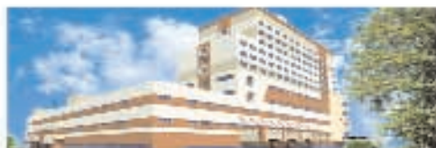
Торгово-развлекательный центр на ул. Тушинская Общая площадь – 34 000 м². Торговая площадь – 24 000 м². Открытие – III квартал 2007 года.