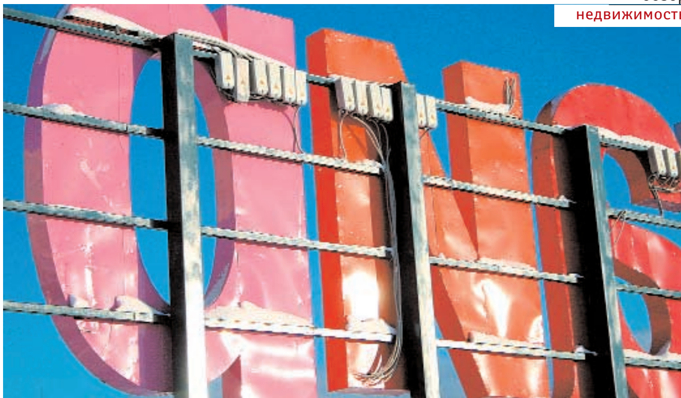
«АЛЬТАИР» НА ЛЕНИНГРАДСКОМ ПРОСПЕКТЕ.

в реконструированных зданиях появились небольшие торговые комплексы («Европа», «Меркурий», «Максималь», «Мир Женщины»). «Малозэтажные торговые центры, например «Европа», «Меркурий», площадью около 3–4 тыс.кв.м с внутренней планировкой в виде коридорной системы и торговыми модулями небольшого размера (в среднем от 50 до 200 кв.м) — типичные представители торговых центров центральной части г. Ярославля», — отмечают специалисты компании «Губернский Город» (Ярославль).