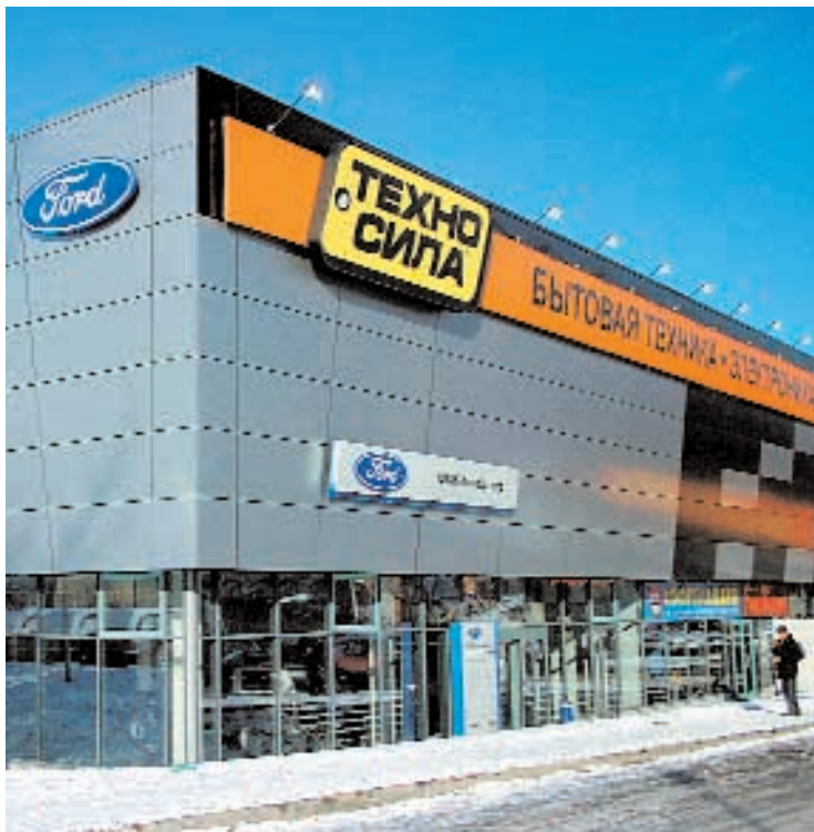
ТК «АВТОГРАФ» НА МОСКОВСКОМ ПРОСПЕКТЕ.

> работать два гипермаркета «Вестер», гипермаркеты REAL , «Наш Гипермаркет» и «Перекресток». Активно развивается в городе краснодарская сеть дискаунтеров «Магнит», в 2006 г. на Московском пр-те на месте почившего в бозе «Гастроном-Эконома» открылся костромской супермаркет «Дом Еды». Местные ритейлеры представлены сетями магазинов у дома и супермаркетов «Лотос-М», «Добрый», «Ярославские Магазины». На рынке бытовой техники и электроники присутствуют крупнейшие сети — «МИР» (2 магазина), «Техносила» (2 магазина), «М.Видео» (1 магазин), «Эльдорадо» (1 магазин). Работают и местные небольшие сети — «Каскад», «Рослан», «Альфа». Рынок товаров для дома также постепенно осваивается сетями — в ТЦ «7 дней» открылся в 2006 г. магазин «Кенгуру», в 2007 г. должны появиться HomeCenter , «Чудо-Дом» и «СтройДепо» («Старик-Хоттабыч»), возможно открытие магазина «Наш Дом» (ГК «Ташир»). Освоились в городе «Л'Этуаль» и ArboMundi , ищет помещения «Арбат-Престиж». Представлены «Детский мир» и сеть аптек «Ригла», салоны сотовой связи DIXIS , «Евросеть», «Связной» и др. В городе работают три ресторана McDonald's , ожидается открытие ресторана Sbarro . «Мы планируем открыть в Ярославле «Ростик'с-KFC» в 2007 г. Открытие концептуальных ресторанов запланировано на 2008-2009 гг.», — сообщили в компании «Ростик Групп».