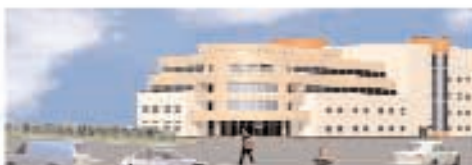
Торгово-развлекательный комплекс, г. Тула, ул. Октябрьская Общая площадь – 17 700 м². Торговая площадь – 11 500 м². Открытие – III квартал 2008 года.