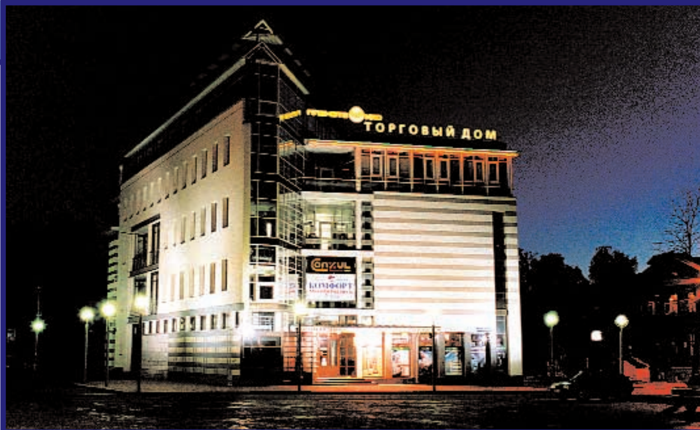
ТЦ Нижнего Новгорода привлекают внимание многих сетевых компаний