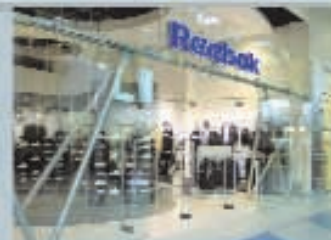
системы NEDAP для защиты широких выходов и модулем удаленного сервиса