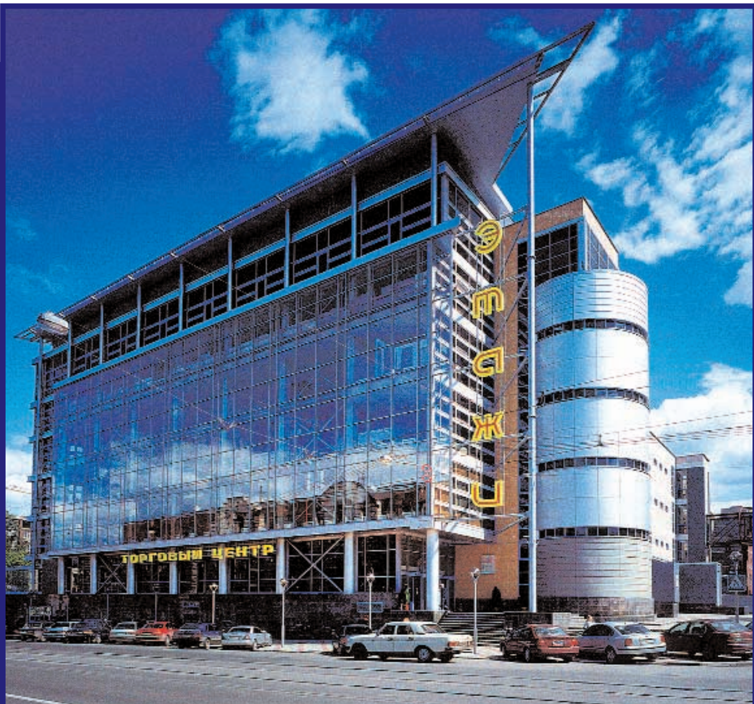
Рост доходов населения Нижнего Новгорода способствовал появлению в 2003 г. таких современных ТЦ, как «Этажи» и «Новая Эра»

ское шоссе, проспекты Ленина и Гагарина, а также около мостов через Оку.