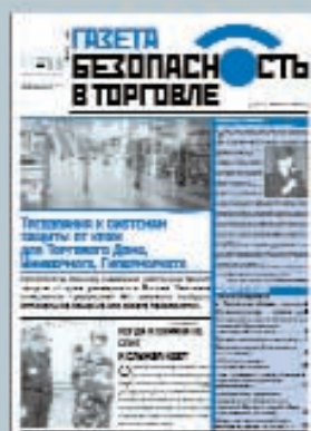
газета «Безопасность в Торговле» подписка по телефону 937 222 8